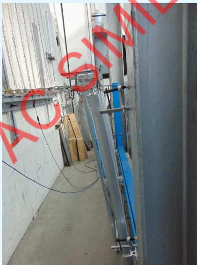
Fotografia del campione sottoposto a carico statico lineare orizzontale.