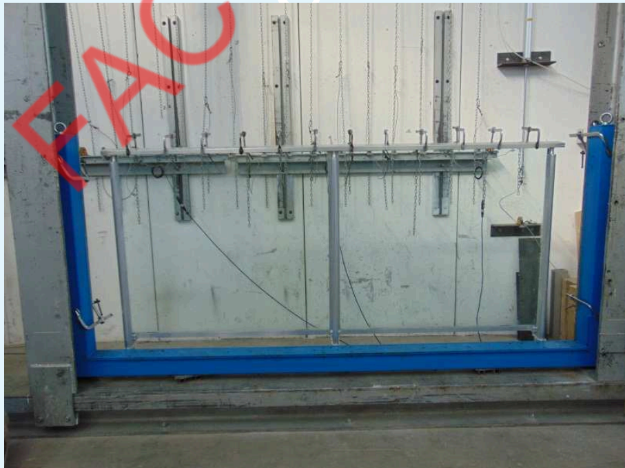
Fotografia del campione.

Per ulteriori dettagli sulle caratteristiche del campione si rimanda ai disegni schematici forniti dal Committente e riportati nell'allegato "A" al presente rapporto di prova.