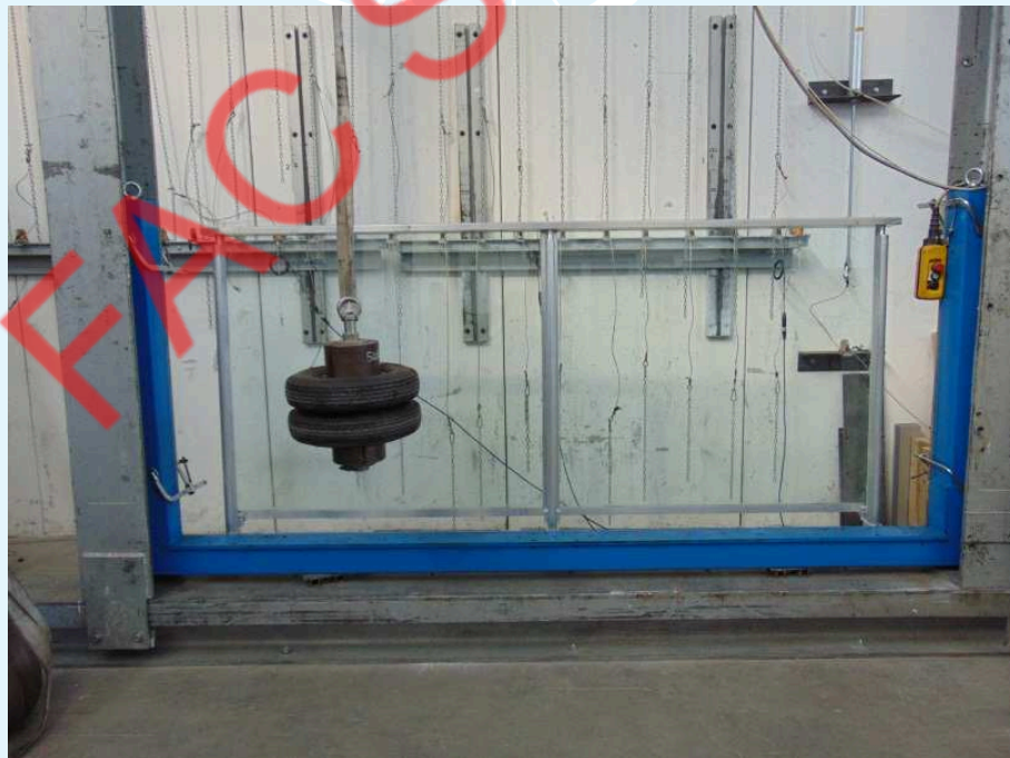
Fotografia del campione dopo l'urto.