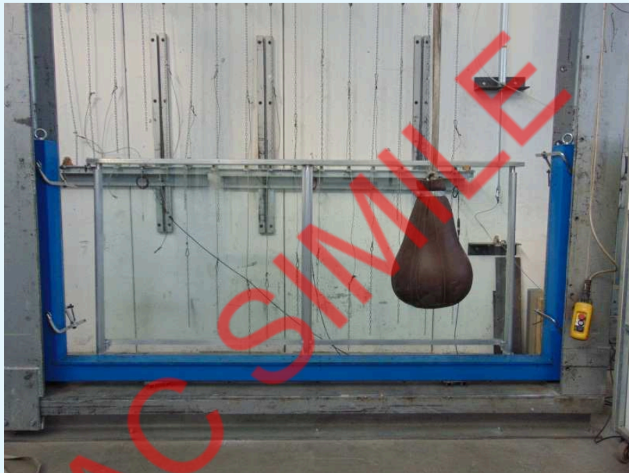
Fotografia del campione dopo l'urto al centro del tamponamento.