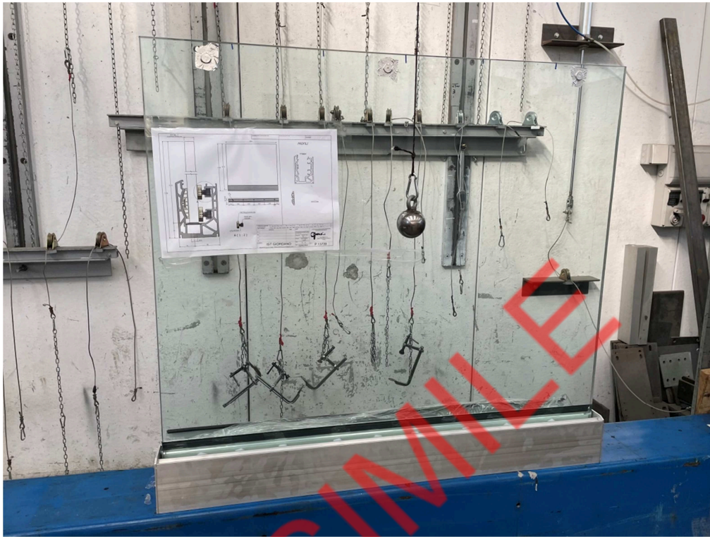
Fotografia dell'oggetto dopo l'impatto da corpo duro al centro del tamponamento