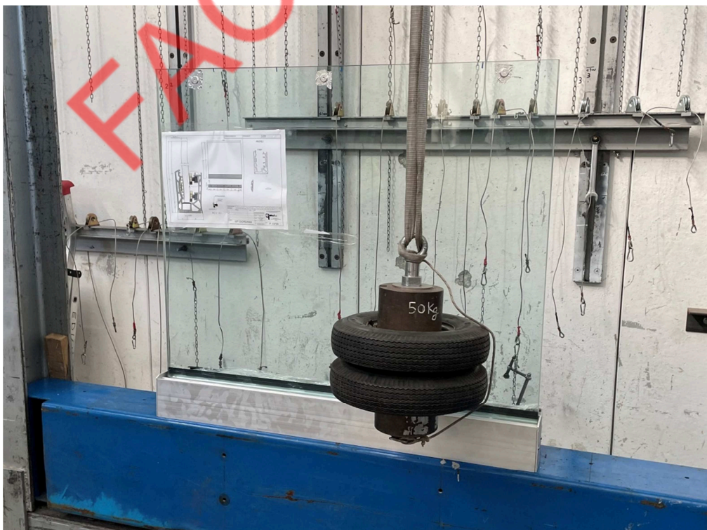
Fotografia dell'oggetto dopo l'impatto da corpo semirigido a 250 mm dall'angolo sulle bisettrici