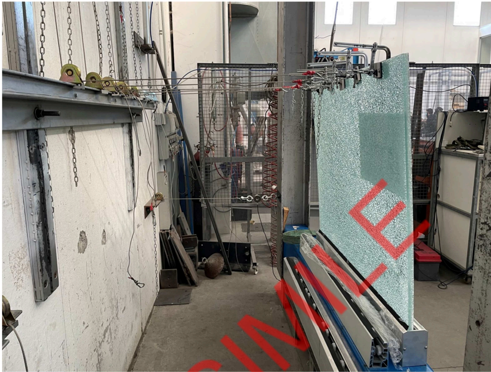
Fotografia dell'oggetto durante l'applicazione del carico di collasso