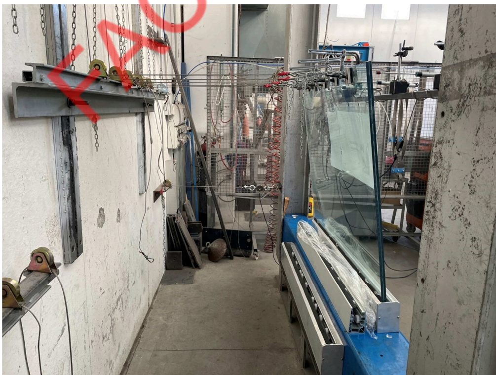
Fotografia dell'oggetto durante l'applicazione del carico limite ultimo