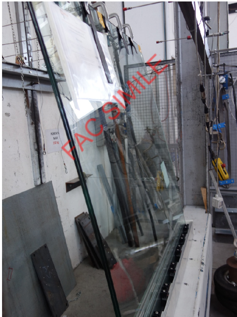
Fotografia dell'oggetto durante la prova di resistenza al carico statico orizzontale lineare