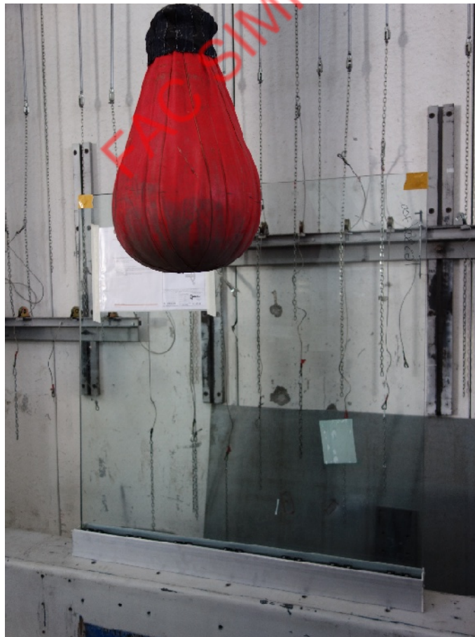
Fotografia dell'oggetto dopo l'urto sul bordo