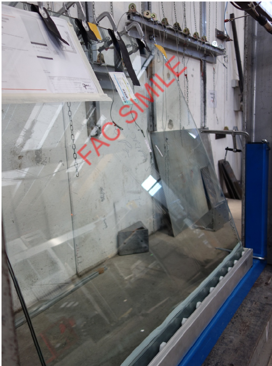
Fotografia dell'oggetto durante la prova di resistenza al carico statico orizzontale lineare