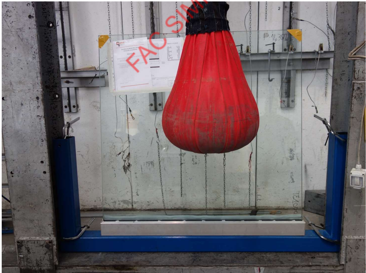
Fotografia dell'oggetto dopo l'urto centrale