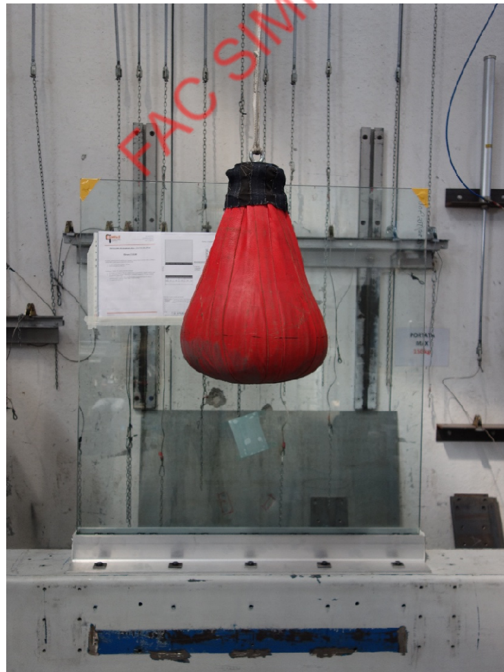
Fotografia dell'oggetto dopo l'urto centrale