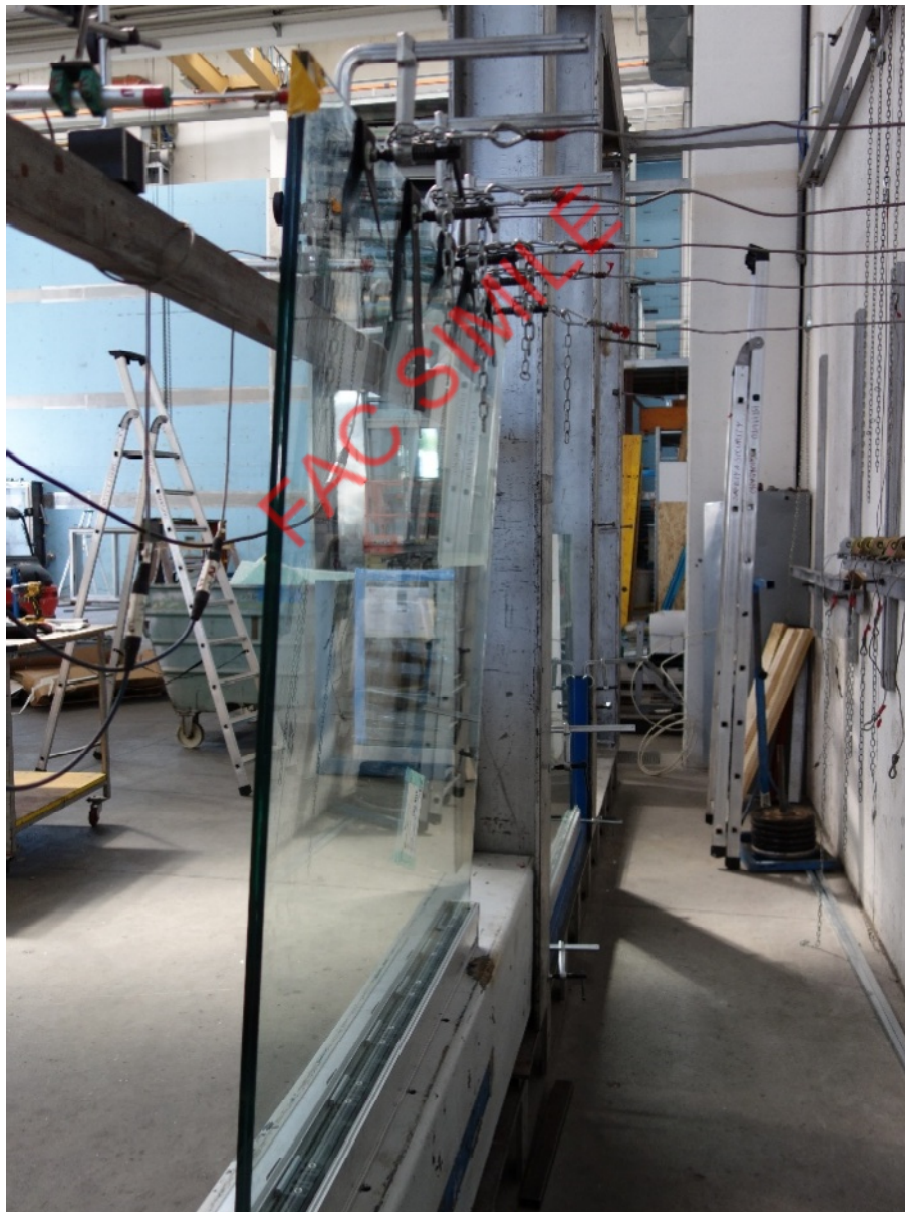
Fotografia dell'oggetto durante la prova di resistenza al carico statico orizzontale lineare